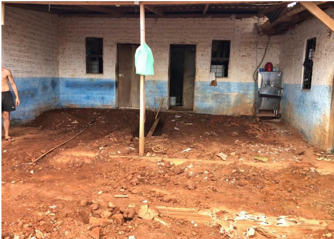
LIMPEZA DA UNIDADE PARA INÍCIO DA REFORMA