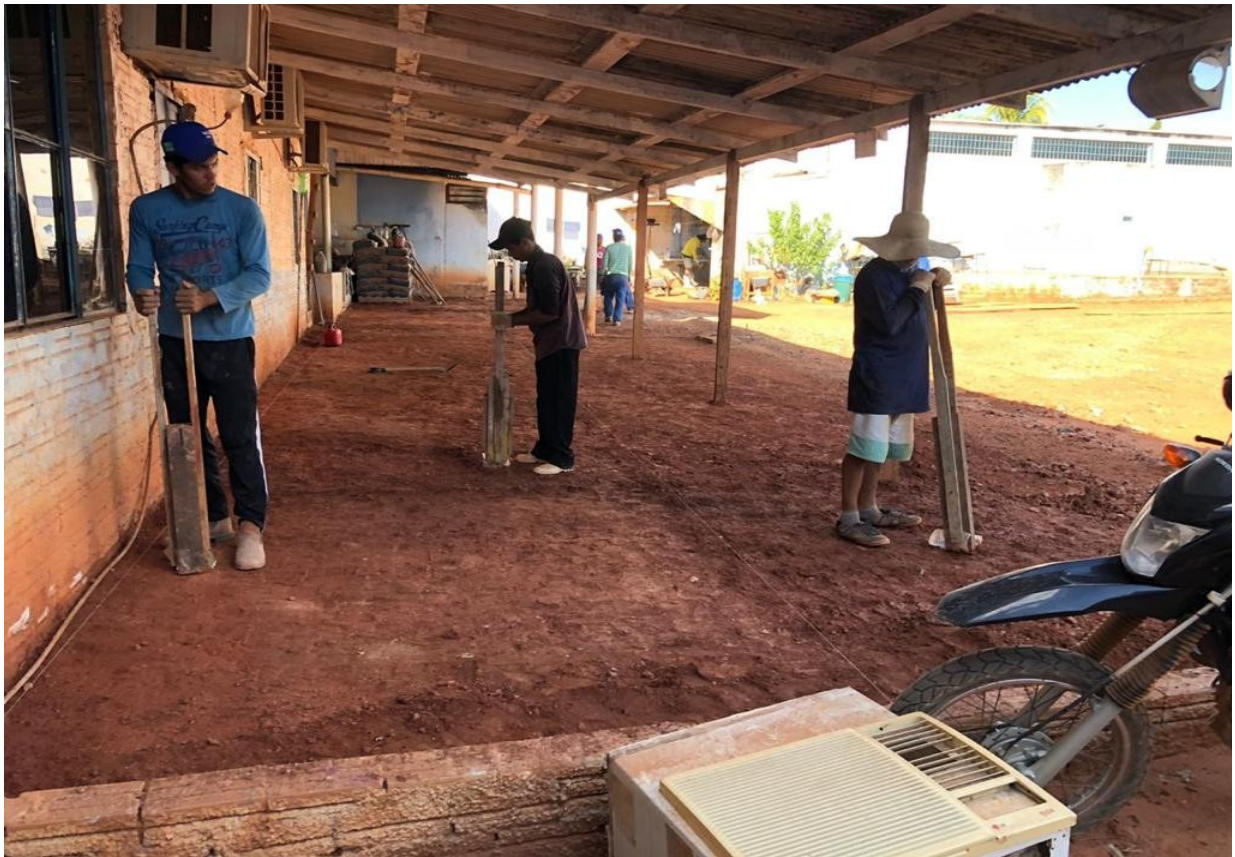
REFORMA CONTRATADA COM EMPRESA LOCAL CONTRATAÇÃO REMUNERADA DE REEDUCANDOS