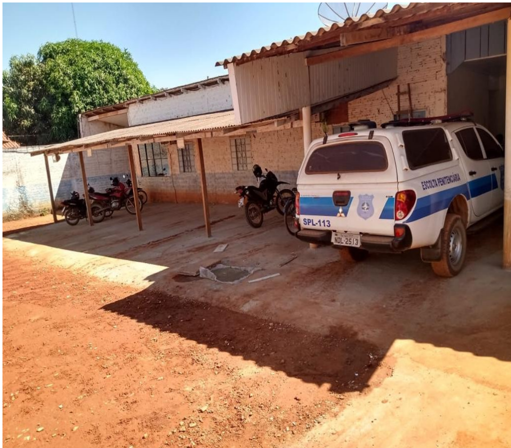
REFORMA DA PARTE EXTERNA