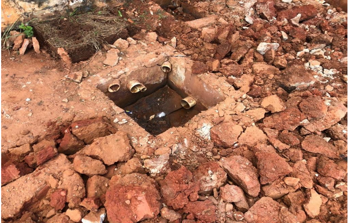
PISO DE BARRO VIRAVA LAMA NA ÉPOCA DAS CHUVAS