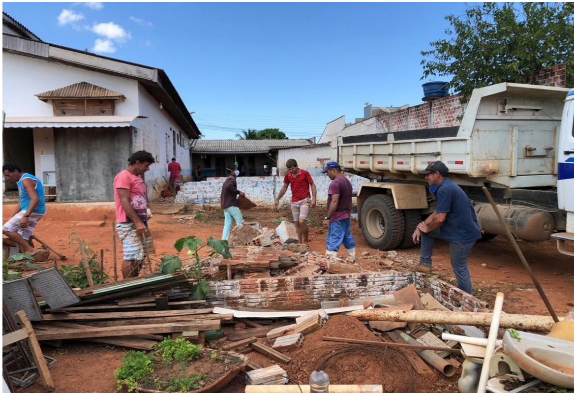
MÃO DE OBRA DOS PRÓPRIOS REEDUCANDOS